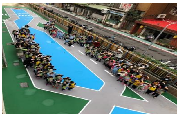
幼童考駕照時專用的腳踏車道