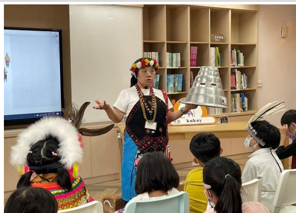
原民博物館導覽活動