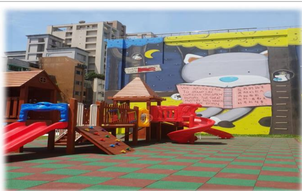
閱讀大壁畫前有幼童最愛的遊戲場

七、 歡樂童年盡在長安附幼： 孩子們快樂成長、健康茁壯是我們共同心願，未來讓我們一起努力，充實孩子們的學習活動、豐富孩子的生活經驗、培養孩子們「帶的走的能力」，創造每位孩子屬於自己的「長安童年」。