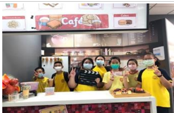
國際小學堂——點餐情境體驗