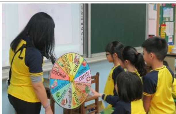
雙語實驗課程——低年級健康課