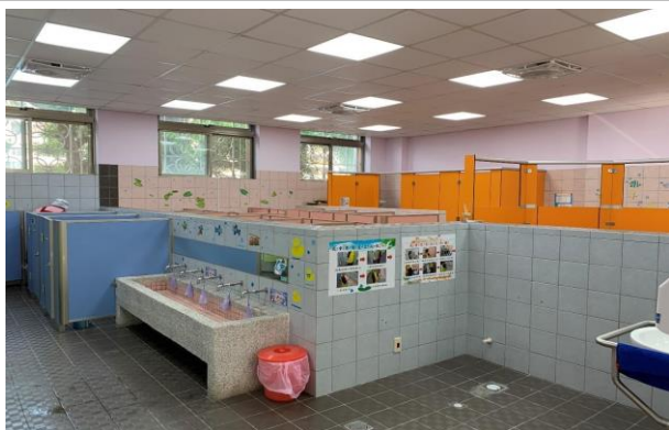
幼兒園乾淨清新的友善廁所