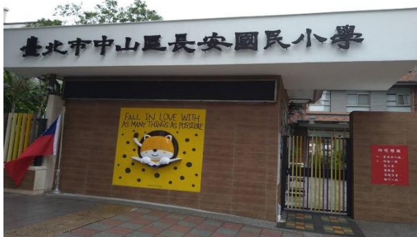
校門口有雙語特色的動物歡迎光臨