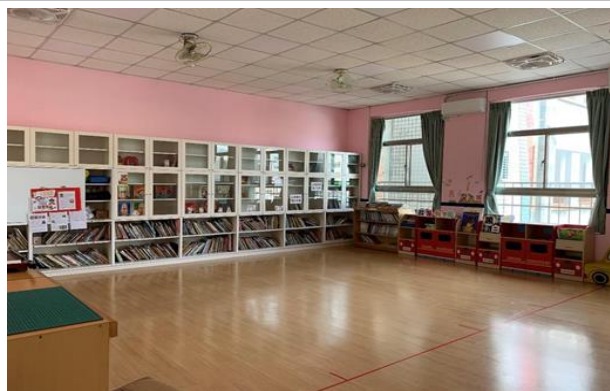
幼兒園寬敞又舒適的故事屋