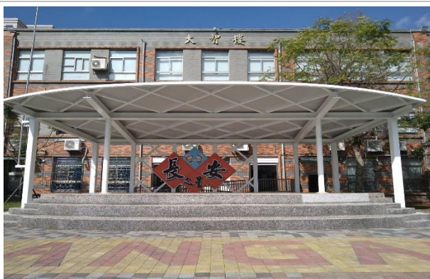
卓越表現者可上「長安之星」領獎