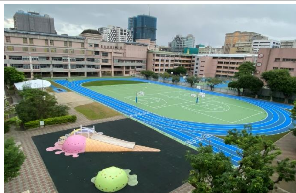
冰淇淋造型的溜滑梯與亮麗的操場