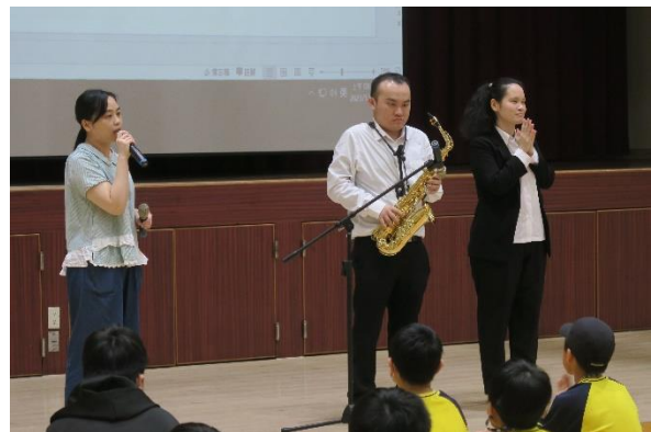
生命教育-伊甸視障生命鬥士分享