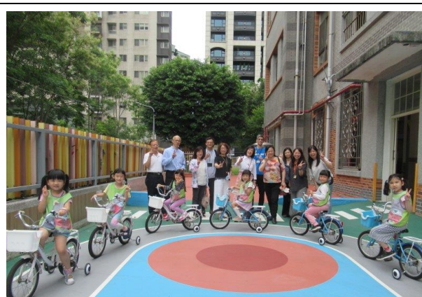
腳踏車道導覽活動