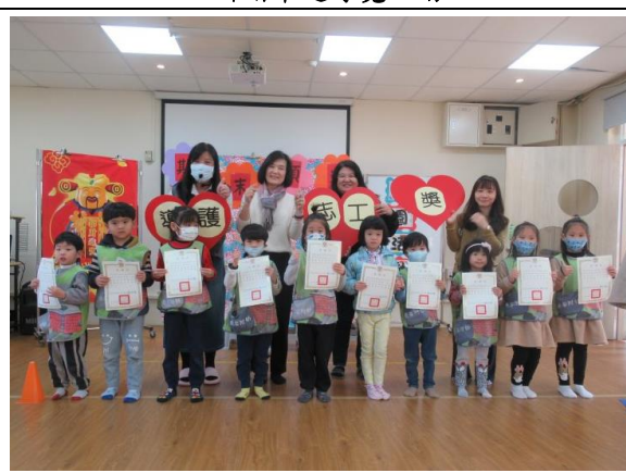
期末導護志工頒獎