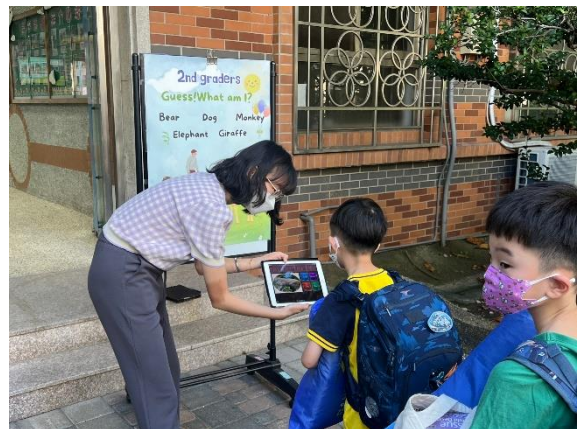
開學日—英語闖關活動