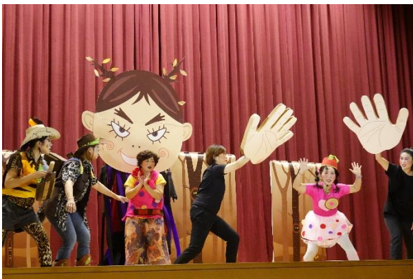
家長會感恩戲劇演出-黑森林歷險記