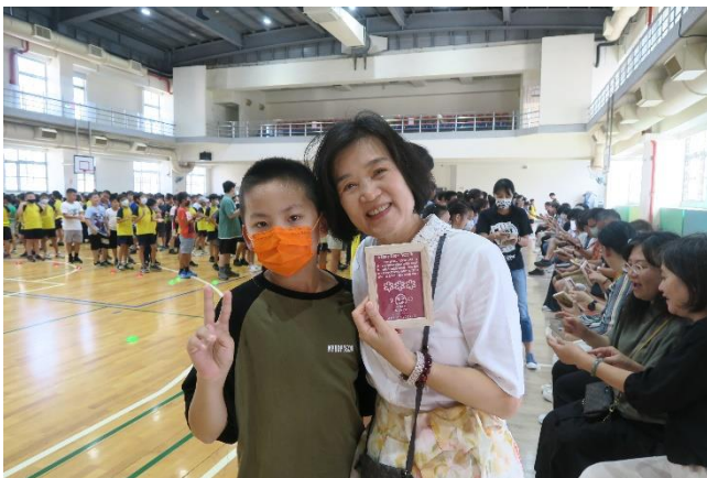
敬師活動-教師米其林獻禮