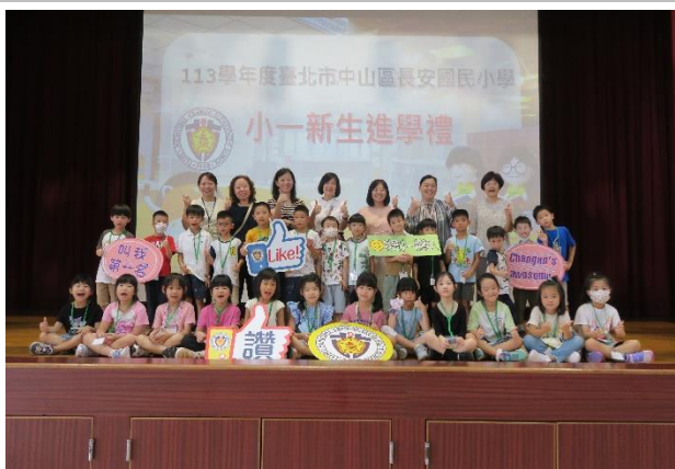
新生進學禮_紀錄新生上學第 1 天