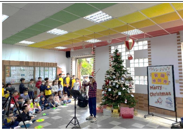
113-1 聖誕快閃_小提琴獨奏