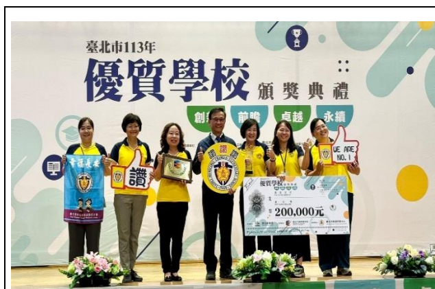
113 年度榮獲優質學校_學校領導向度

「不是有了同行者才上路，是因為你在路上才會同行者」。長安親師生團隊同行，共創幸福長安，一起擁抱 E 世代----