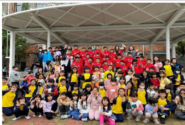
聖誕快閃秀_棒球隊表演「臺灣尚勇」