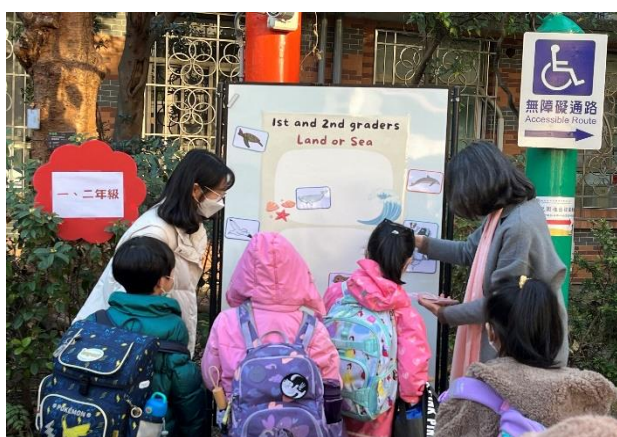
113-2 開學日低年級及英語闖關