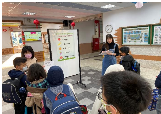
113-2 開學日中年級及英語闖關