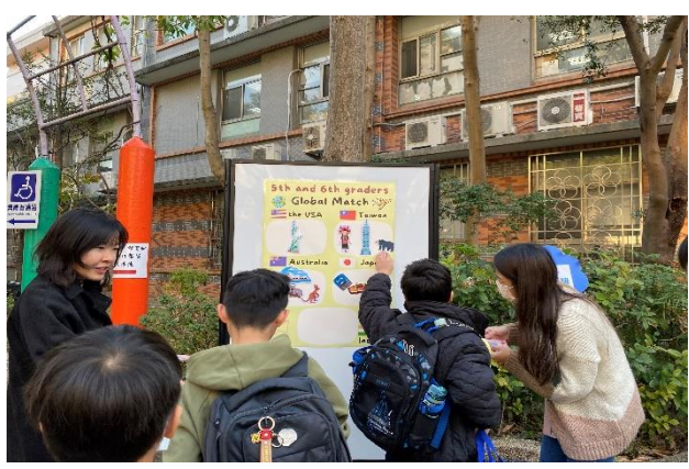
113-2 開學日_高英語闖關活動