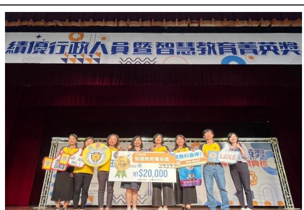
榮獲績優行政人員暨智慧教育團隊菁英獎