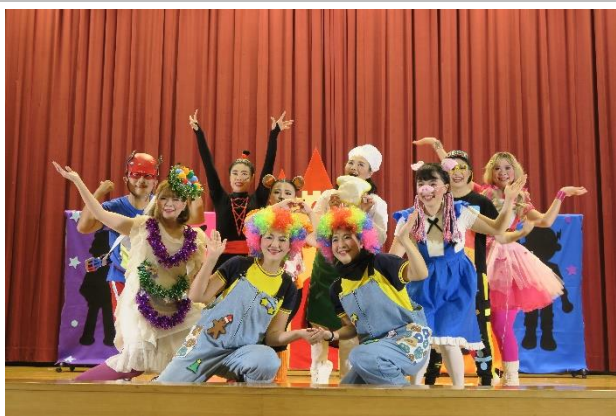
歲末聖誕感恩戲劇_家長志工精彩演出