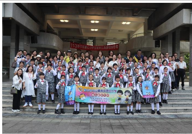
合唱團參加 113 學年度臺北市音樂比賽 榮獲西區乙組第一名