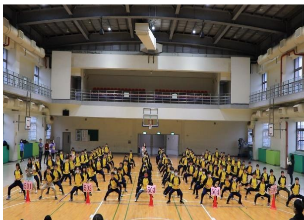
3-6 年級長安武術拳比賽