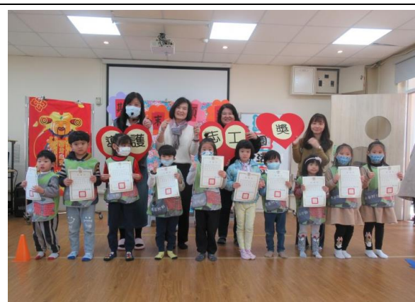
期末導護志工頒獎