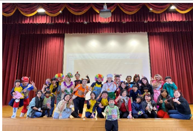
幕前幕後之戲劇志工與其子女留念