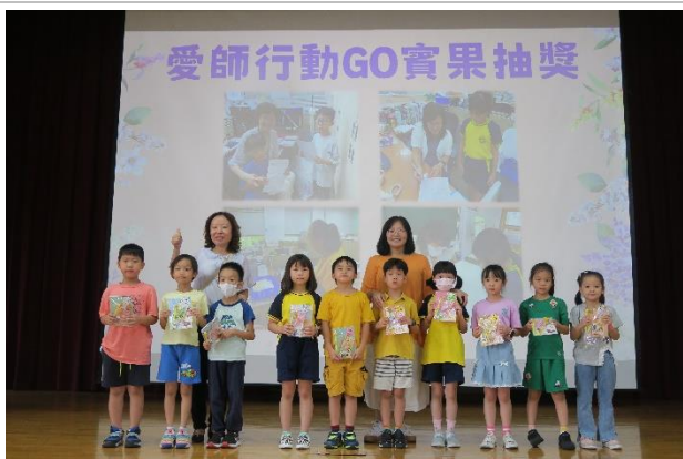
敬師活動_愛師行動抽獎