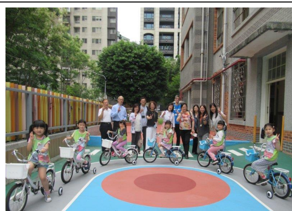
腳踏車道導覽活動