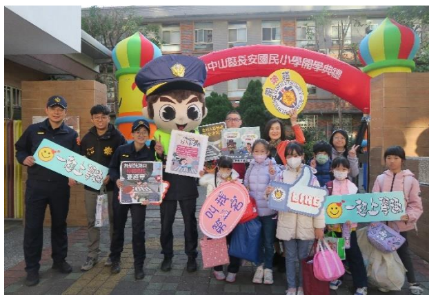
113-2 開學日迎接學生來上學