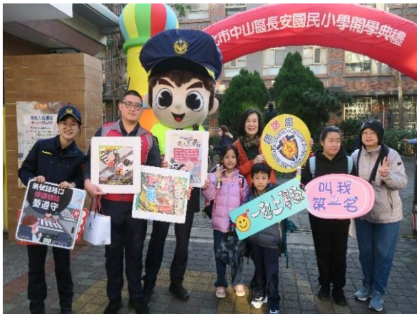
113-2 開學日迎接學生來上學