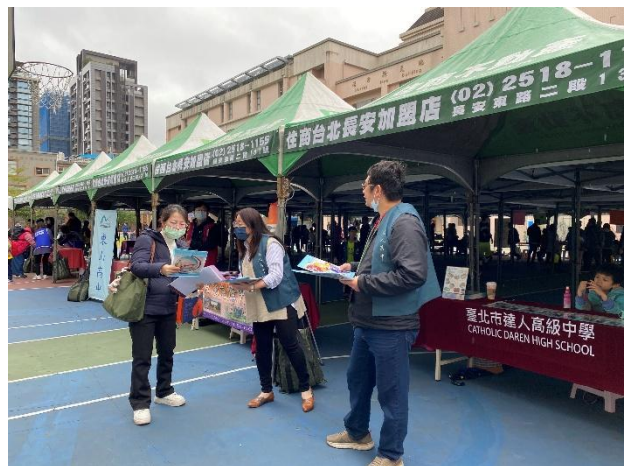
園遊會邀請私校設攤進行國中升學說明