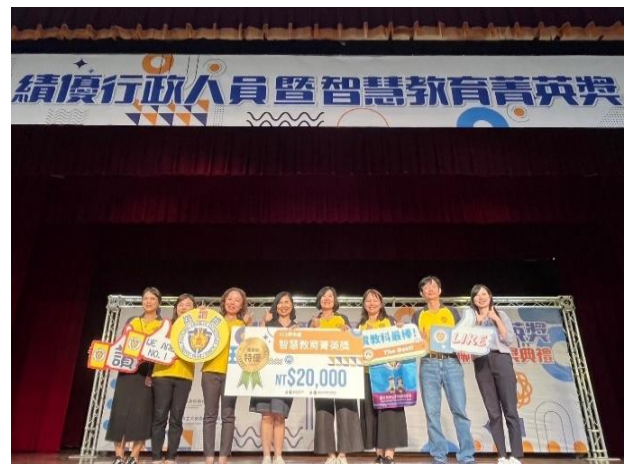
榮獲績優行政人員暨智慧教育團隊菁英獎