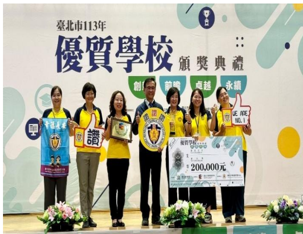
113 年度榮獲優質學校_學校領導向度