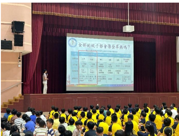
登革熱防治定期宣導並檢查容器